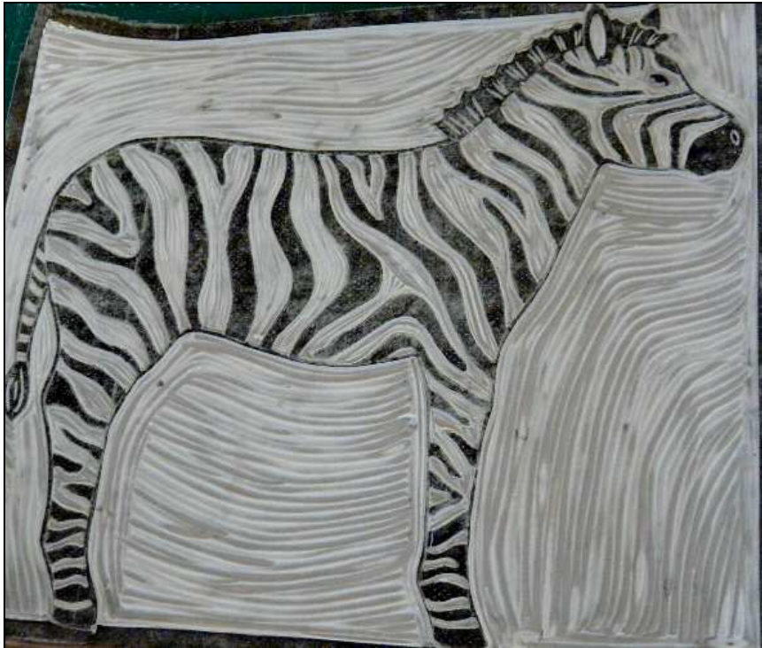
PVC-Belag mit fester Rückseite