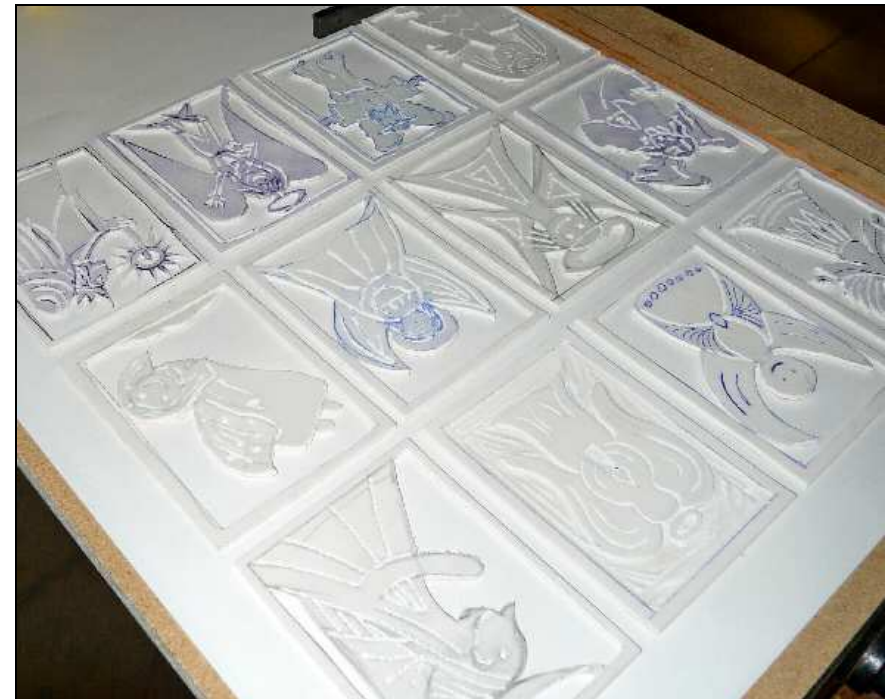
Gemeinschaftsarbeit zum Thema Engel: PVC mit weicher Rückseite direkt auf den Druckstock entworfen und mit der Schere ausgeschnitten.

Die weichere Rückseite eignet sich hervorragend für flächige Arbeiten, ähnlich dem Papierschnitt. Mir fallen dabei die Arbeiten des Künstlers Matisse ein. Die Figur kann dann mit einer scharfen kleinen Schere kinderleicht ausgeschnitten werden. Eine Feinarbeitung der Figur, eine Schraffur oder Ähnliches ist nur eingeschränkt, aber mit einem sehr scharfen Messer trotzdem möglich. Das weiche Trägermaterial franst sehr leicht aus und eine scharfe und klare Konturlinie ist damit nur bedingt möglich. Aber auch das kann seinen Reiz haben. Es sollte nur von vornherein berücksichtigt und als Gestaltungselement eingesetzt werden.