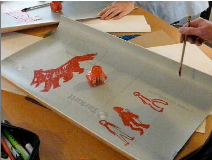
Entwurf mit Tusche oder Kugelschreiber direkt auf das PVC gezeichnet.

Beim Drucken mit einem PVC-Belag wird immer die Rückseite verwendet. Es gibt Fußböden-Beläge mit einer weichen Rückseite und solche mit einer harten. Deshalb empfiehlt sich, immer erst eine kleine Menge in den Baumärkten zu kaufen und ausgiebig zu testen.