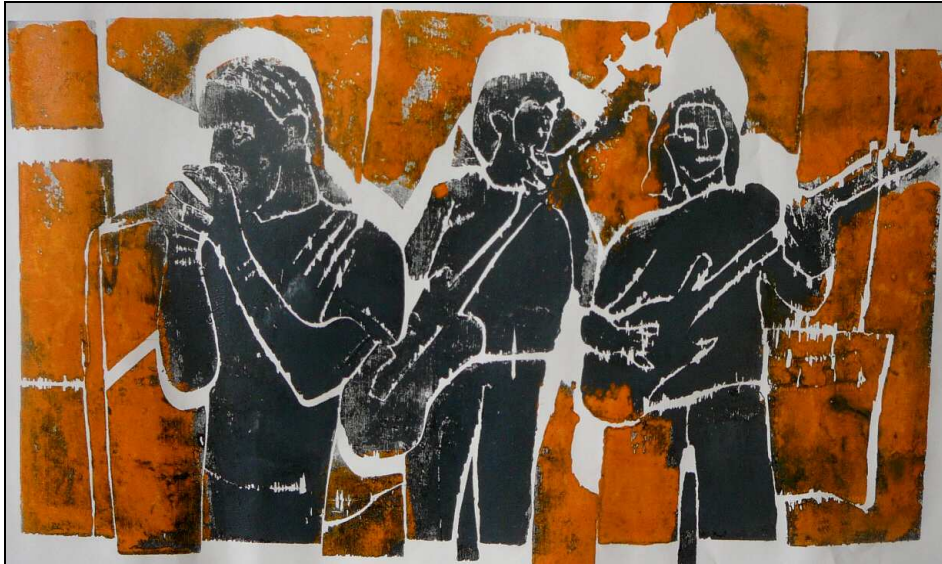
Spiel mit verschieben der Teile und verschiedenen Farben.

Beim Mehrfarbendruck werden einfach die Puzzleteile von der Selbstklebefolie gezogen, die nicht in der gewünschten Farbe drucken sollen. Der Druckstock wird dann eingewalzt und passgenau auf den vorhergehenden Druck gedruckt. Nach dem Druck werden die Teile wieder in den Druckstock eingefügt und eine andere Farbe kann in der gleichen Art gedruckt werden.